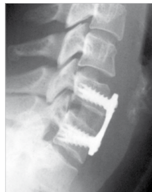
f, 29 yrs., discoligamentous instability C6/C7 with subluxation on the right, nerve root compression syndrome C7.