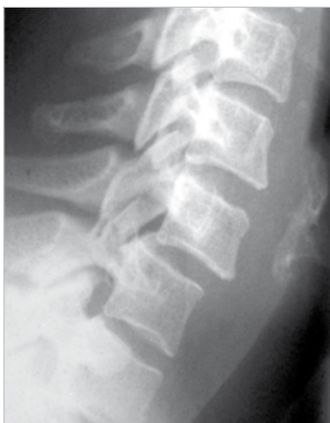
w, 29 J., diskoligamentäre Instabilität C6/C7 bei Subluxation rechts mit Wurzelkompressionssyndrom C7.

Instabilities resulting from various causes e.g. conditions after anterior removal of the intervertebral disc, fracture, tumor or pseudarthrosis resulting from previous unsuccessful operations of the cervical spine.